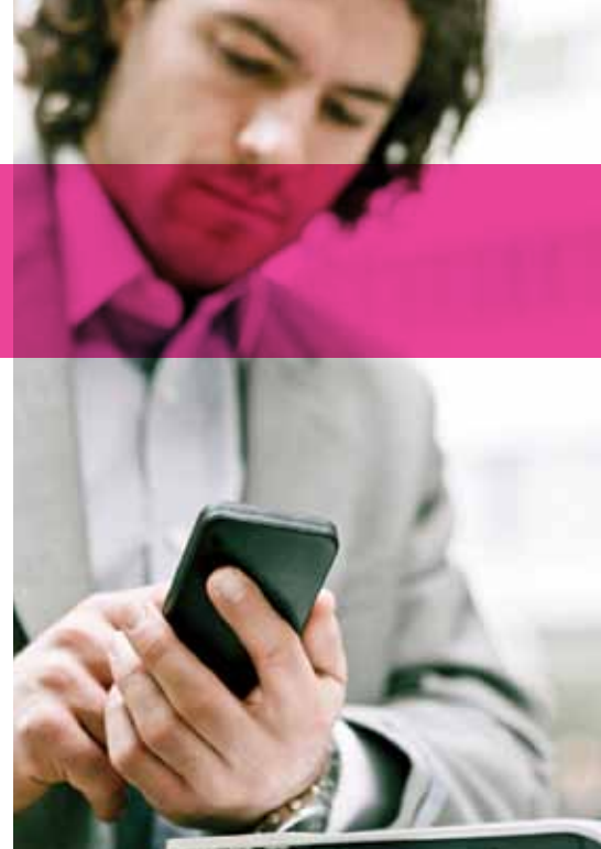
Ilustración 1. Gama de soluciones de comunicación Alcatel-Lucent Office

Nuestra gama se basa en estándares abiertos y fiables. Las soluciones de comunicación Alcatel-Lucent Office son modulares en todos los niveles, desde los conjuntos de comunicación y las licencias de software, hasta los servidores de comunicación y la infraestructura de red, que respetan escrupulosamente los requisitos de los clientes. Puede usted adquirirla con una garantía de hardware y una serie de servicios, que van desde el simple contrato de mantenimiento hasta un sistema completo con nuevas aplicaciones y tecnologías. Las soluciones de comunicación Alcatel-Lucent Office están preparadas para el futuro y se basan en un servidor de comunicaciones IP con protocolos estándar y potentes funciones.